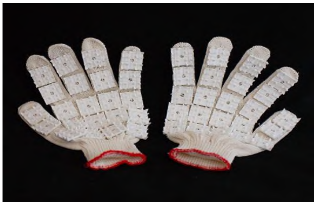
Ладонку к ладошке

Жили-были Ладонки. Они были очень озорные, все время что-то делали, играли в разные игры. Вот и сегодня решили Ладонки весело поиграть. Поздоровались со всеми: «Здравствуй!» (поочередное нажатие большого пальца на подушечки остальных пальцев; для усложнения задачи – одновременное выполнение на правой и левой руке). Потом решили запустить воздушный шарик (пальцами рук изобразить воздушный шар, волнообразными движениями имитируем полет шарика вверх и хлопаем в ладоши – лопнул шарик; 3-4 раза с усилением хлопка). Устали ладошки и решили отдохнуть, сделать массаж, погладить друг друга (поглаживающие движения от кончиков пальцев). И вдруг они увидели какие-то странные ладошки-варежки. Подошли поближе (средним и указательным пальцами обеих рук изображаем ходьбу) и решили примерить их.